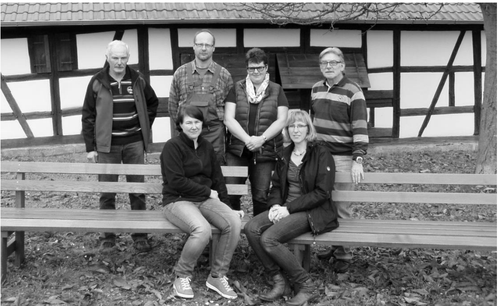
Bild: Die neuen Bänke mit der Vorstandschaft des OGV Rappershausen;