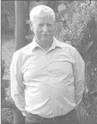
Hendungen, im Januar 2024

Wenn wir Dir auch die Ruhe gönnen, so ist voll Trauer unser Herz, Dich leiden sehen und nicht helfen können, war für uns der größte Schmerz.