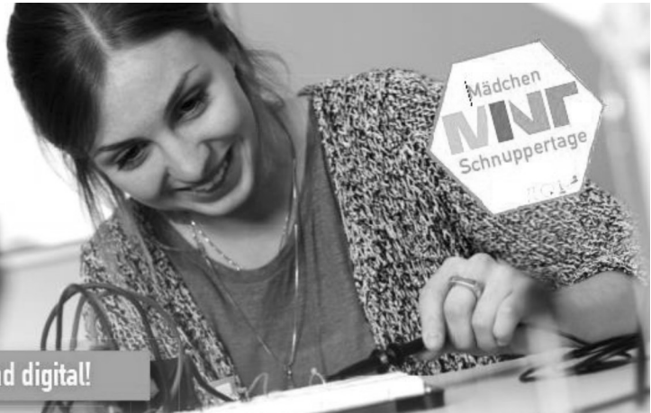
Ort: zdi-Schülerlabor cobMINT-pasaborn

Melde dich jetzt an unter: http://schnuppertage.fhws.de